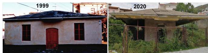
Црква Св. Николе (Рајкова)

Одбор за обнову Цркве Св. Пантелејмона је јавну акцију прикупљања средстава започету јуна 2020. г. успешно окончао за неколико месеци. Веома брзо су започети радови и штета настала на цркви је санирана. У току је опремање унутрашњости цркве.