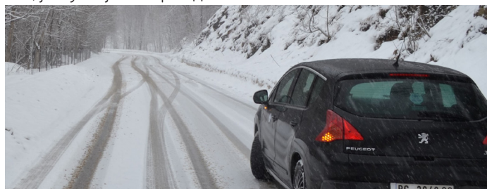
Пут према хотелу Молика

Напуштајући нашег саговорника и настављајући пут даље до наших наредних саговорника, имали смо прилике да се и сами уверимо у то. Кренули смо до хотела „Лахор“, где су до скоро живела расељена лица која су добила станове у новим зградама. Пејзаж бајковит, али само за оне који повремени долазе на ову планину. За оне који ту стално живе, утисак је сасвим другачији. Нисмо успели да пређемо ни два километра према Молики, наше возило је почело да проклизава, а ламела да гори. Морали смо назад. На сву срећу, пут до наших саговорника, иако стварно под великим успоном, још увек је био проходан.