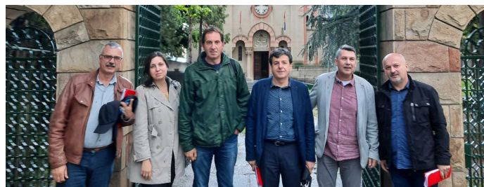
Део чланова одбора за обнову цркве Св. Пантелејмон

Призрен је заједничка именица за све Србе. То се показало приликом обнове призренских светиња. Током обнове ове две цркве забележено је пуно дивних примера приложништва добротворних који у очувању православне културне баштине Косова и Метохије и царског Призрена виде очување сопственог историјског и националног идентитета. Ако чувамо светиње као чуваре и доказ нашег трајања, сачуваћемо себе и будућност своје деце.