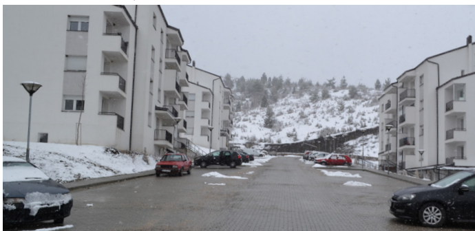
Зграде за расељене

Први пут стижемо испред нових зграда, изграђених за смештај интерно-интерно расељених лица (лица која су расељена унутар КиМ), у које су се уселили јануара 2021. године. Као и све што је ново, изгледају лепо и налазе се на лепом месту, на узвишици изнад Брезовице. Велики и простран паркинг простор испред зграда, што је неубичајено за услове у централној Србији, са неколико старих возила која одавно нису у функцији, указује да су становници зграда особе не тако доброг имовног стања. Остајемо у уверењу да ће након 22. године од живота у колективним центрима и ове породице сада имати простора да себи створе мало лагоднији живот. Зграде су изграђене од средстава Европске Уније, суфинансиране из средстава Министарства за заједнице и повратак, пројекат је подржан од стране општине Штрпце, а реализован од стране Данског савета за избеглице.