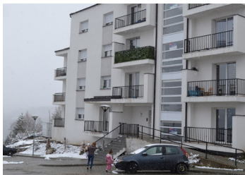
Зграда за расељене

сам за руку." Он мени, „Сутра снимамо руке.“ „Како сутра?“, му кажем ја, „Ја сам сада дошла. Ја на Косово живим, па сам пала и рука скршила“. Он ме погледа, па ме пита „Још живиш тамо?“ Ја му ви-кам, „Још, ће живим тамо док не умрем.“ И однесе ме да ме снима. После, код једног професора ме одведе, кроз неки ходници, код ти доктори, и гледају снимак на тај телевизор, и каже, „Не мајко, не ти се дробу коска, добро је, расте.“